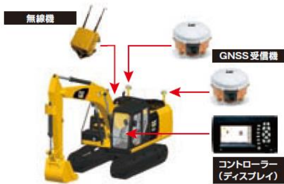
《3次元アップグレード機器装着イメージ(※図はGNSS仕様)》