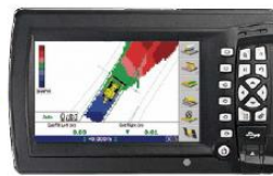
ディスプレイ *画面イメージです。