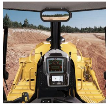
ビルトインディスプレイ