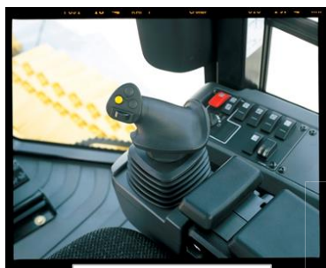
専用ジョイスティック