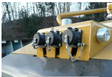
クイックディスコネクト