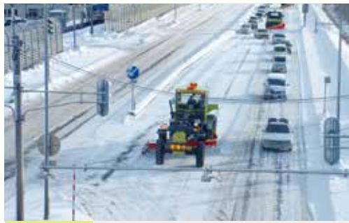
平成25年 除雪延長 6,686km 除雪車台数 1,030台