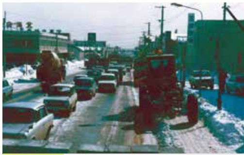
昭和50年 除雪延長 5,653km 除雪車台数 722台