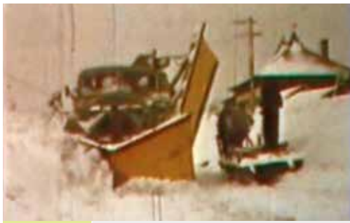
昭和30年 除雪延長 1,414km 除雪車台数 95台