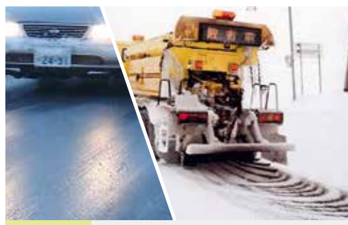
凍結防止剤 防滑材散布