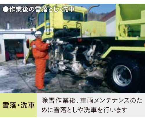
●作業後の雪落とし・洗車 雪落・洗車 除雪作業後、車両メンテナンスのために雪落としや洗車を行います