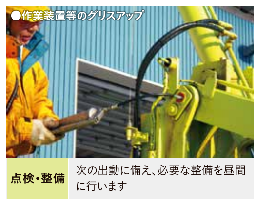
●作業装置等のグリスアップ 点検・整備 次の出動に備え、必要な整備を昼間に行います