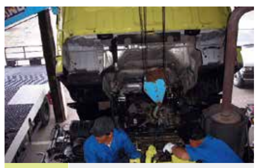
定期点検整備 夏の間定期点検整備を行い除雪期間中の故障を防ぎます

豪雪時には24時間体制で作業を行うなど、除雪車には常に大きな負荷がかかっています。この過酷な環境下でも長期使用に耐えられるよう、過去の故障データを参考にした効果的な整備を行って、除雪作業に支障が無いよう、万全の体制をとっています。