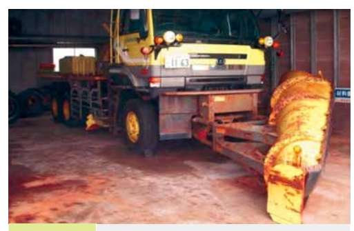
機械の更新 整備不可能なほど老朽化した除雪車はその一生を終え、更新されます