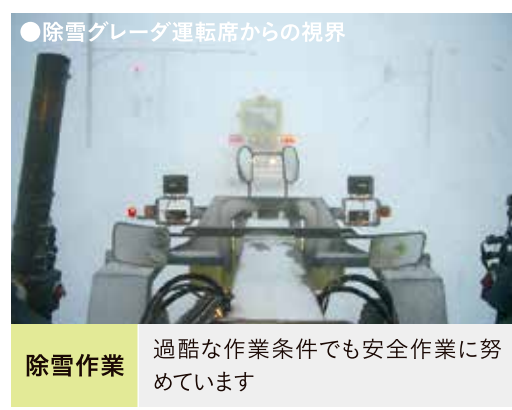
●除雪グレーダ運転席からの視界 除雪作業 過酷な作業条件でも安全作業に努めています