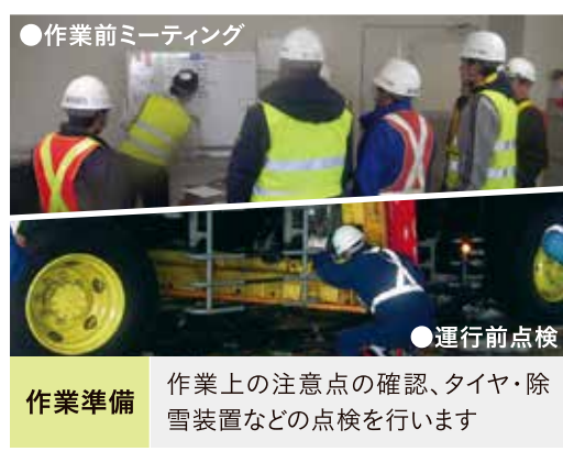
●作業前ミーティング ●運行前点検 作業準備 作業上の注意点の確認、タイヤ・除雪装置などの点検を行います